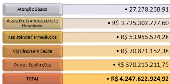
Figura 1 - Aplicação em Saúde por Área de Atuação - Janeiro a Dezembro/2023

Dentre as despesas que apresentam com maior volume aplicado, está a Atenção Ambulatorial e Hospitalar perfazendo o total de R$ 3,7 bilhões, assistência farmacêutica R$ 53,9 milhões, vigilância em saúde R$ 70,8 bilhões, conforme abaixo.