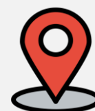
Nº DE SUSPEITOS DE MONKEYPOX SEGUNDO MUNICÍPIO DE RESIDÊNCIA, MARANHÃO, 2022.