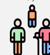
Nº DE SUSPEITOS DE MONKEYPOX, SEGUNDO FAIXA ETÁRIA, MARANHÃO, 2022.